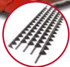
30 fods kniv Kr. 3.730,-