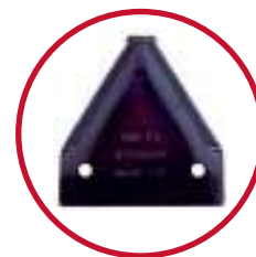
Græskniv Kr. 10,-