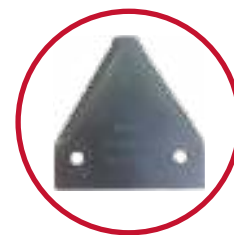
Standardkniv Kr. 7,-

Når du vælger original kvalitet fra Case IH, kan du være sikker på, at det er reservedele, der er specifikt designet til din maskine.