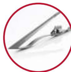
Akshæver Kr. 133,-