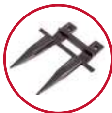
Knivfinger 30 fod Kr. 95,-

De forskellige komponenter i din mejetærsker udsættes for et enormt pres i høstperioden.